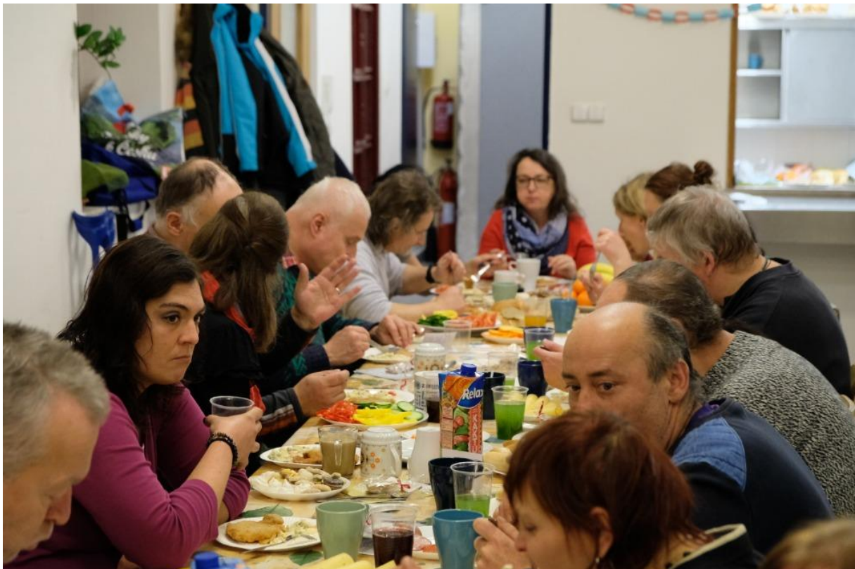
Ilustrační fotografie: Mezinárodní vězeňské společnosti, z.s.